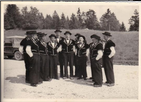
<<< Sonntäglicher Ausflug in den Jura mit Konzert