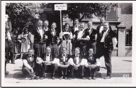
1936 Eidg. Jodlerfest in Solothurn