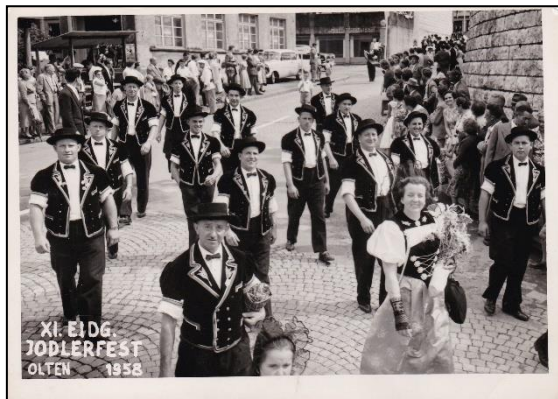
1958 Eidg. Jodlerfest in Olten am Umzug