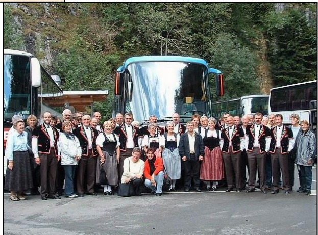
2003 Jodlerreise mit Freunden ins Wallis