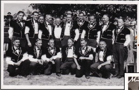
<<< Bern. Kant. Schwingfest 1947 in Büren an der Aare