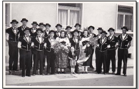
1955 Eidg. Jodlerfest in Fribourg