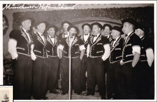
Auftritt im Hofbräuhaus in München während einer >>> Jodlerreise im Jahre 1961