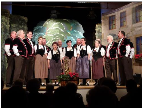
Konzert und Theater im Jahr 2017