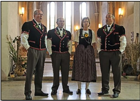
Quartett vom „Meiglöggli“