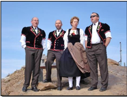
Jodlerreise 2008 ins >> Graubünden