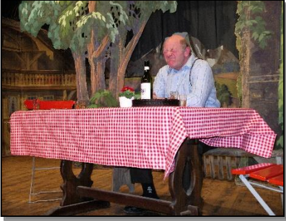
E lischtige Chächt 2006