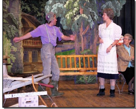
Junggselle uf Abwäge 2009