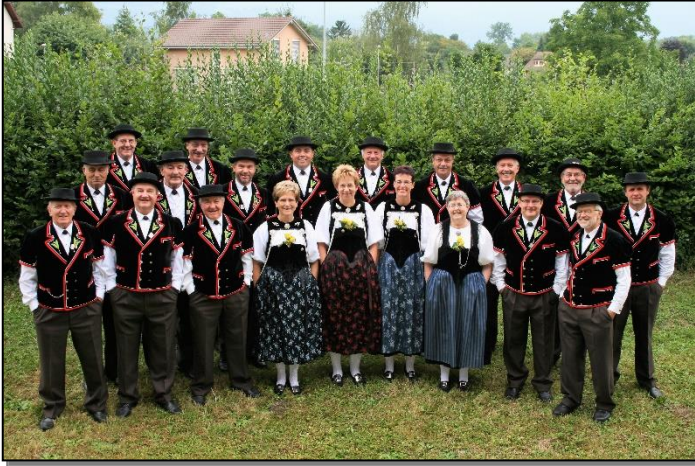
Jodlerklub „Meiglöggli“ im Jahr 2010