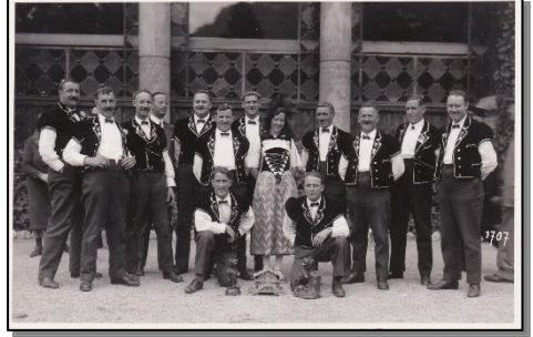
1933 Kant. Jodlerfest in Interlaken