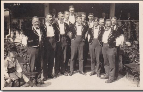
1927 Eidg. Jodlerfest in Luzern