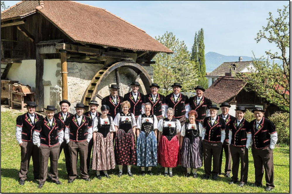
Quartett vom „Meiglöggli“